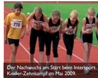
Der Nachwuchs am Start beim Intersport Kinder-Zehnkampf im Mai 2009.