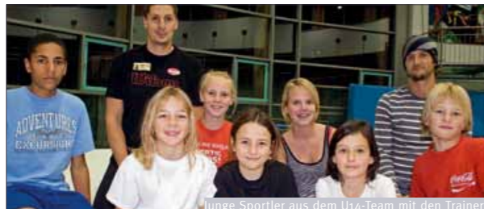
Junge Sportler aus dem U14-Team mit den Trainern

Leichtathletik als Persönlichkeitsschule. Seit Oktober wird jeden Dienstag und Donnerstag [16–18 Uhr] ein Grundlagentraining für Zehn- bis Vierzehnjährige auf Basis der Grundsportarten Leichtathletik, Turnen sowie der Sports Spiele angeboten. Im Vordergrund steht eine umfassende Bewegungsausbildung der Kinder, ein Hinführen zur Freude am Sich-Messen und das bewusste Annehmen von Herausforderungen! Dieses neue U-14-Team der Union Salzburg wird eine großartige, positive Gemeinschaft werden, in der jeder Einzelne ein wichtiger und anerkannter Teil sein wird. Sie sollen in Zukunft auch die österreichische Leichtathletik-Gemeinschaft bereichern.